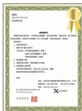
中文版录取通知书