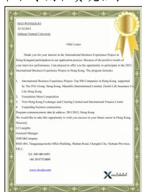
英文版录取通知书

(2) 面试通过者，信华教育工作人员会在接下来的 5 至 7 个工作日内向同学寄发录取通知书和专用收费凭证；